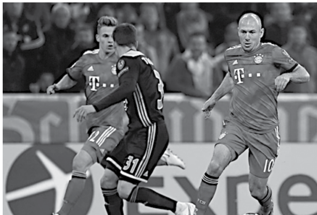
Calendário de jogos internacionais dos clubes europeus já está preenchido até a temporada de 2024

"Já repetimos diversas vezes que o Calendário de Partidas Internacionais e demais competições já estão definidas e acertadas