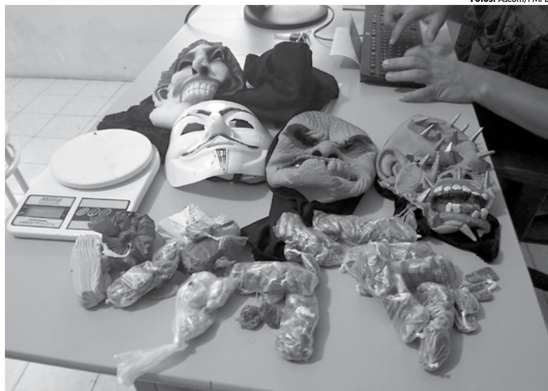
Máscaras, drogas, balança de precisão e outros materiais foram apreendidos durante as duas operações