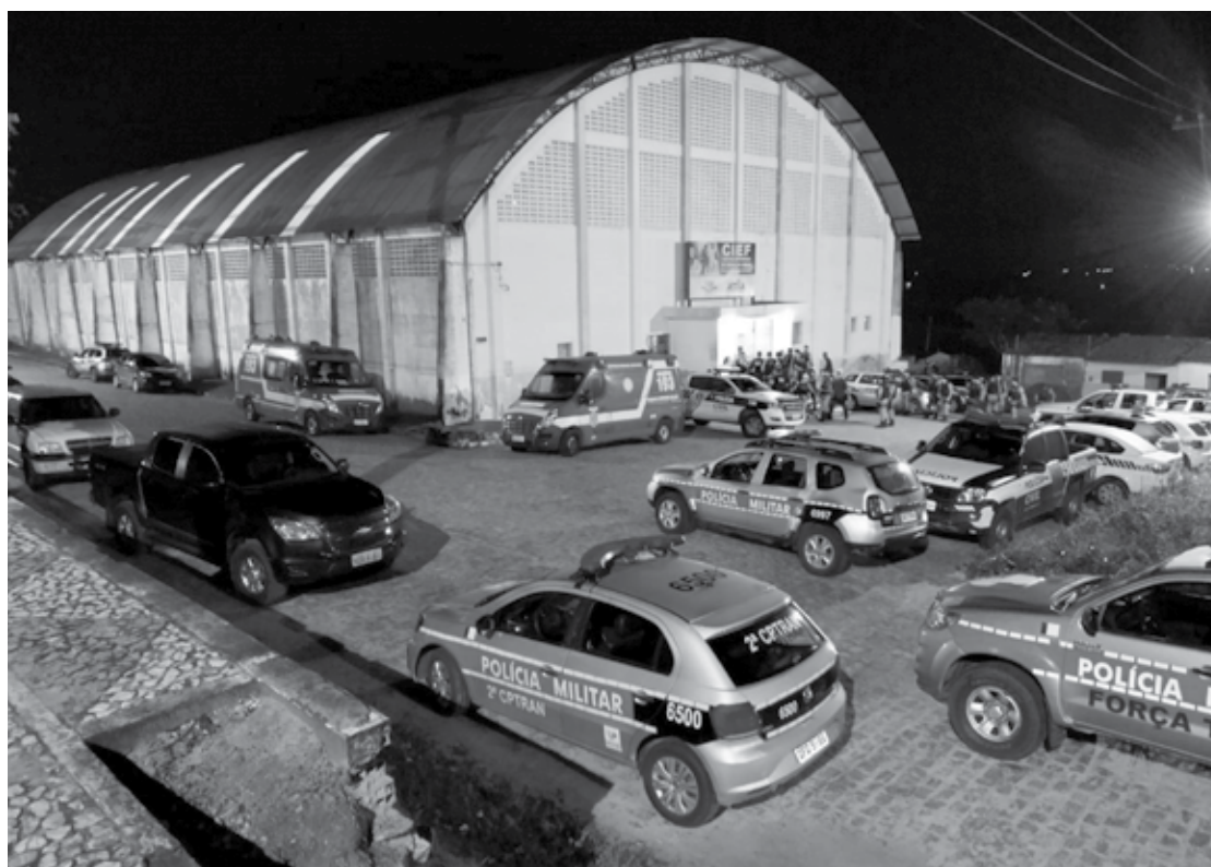
Na região do Brejo, a concentração dos policiais aconteceu em ginásio de esportes na cidade de Pombal