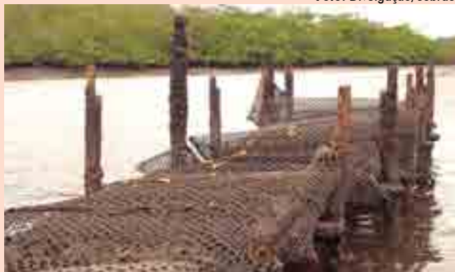
Marcação recebeu o projeto de ostricultura do Sebrae Paraíba