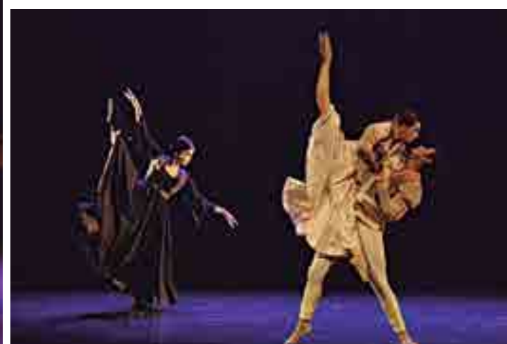
Acima, cena do espetáculo 'Marias', do Ballet Jovem da Paraíba, que abrirá a programação da Mostra Estadual de Teatro, Dança e Circo, a partir das 18h. No alto, 'Anáguas', e - acima - cena de '2/4 Romeu e Julieta'