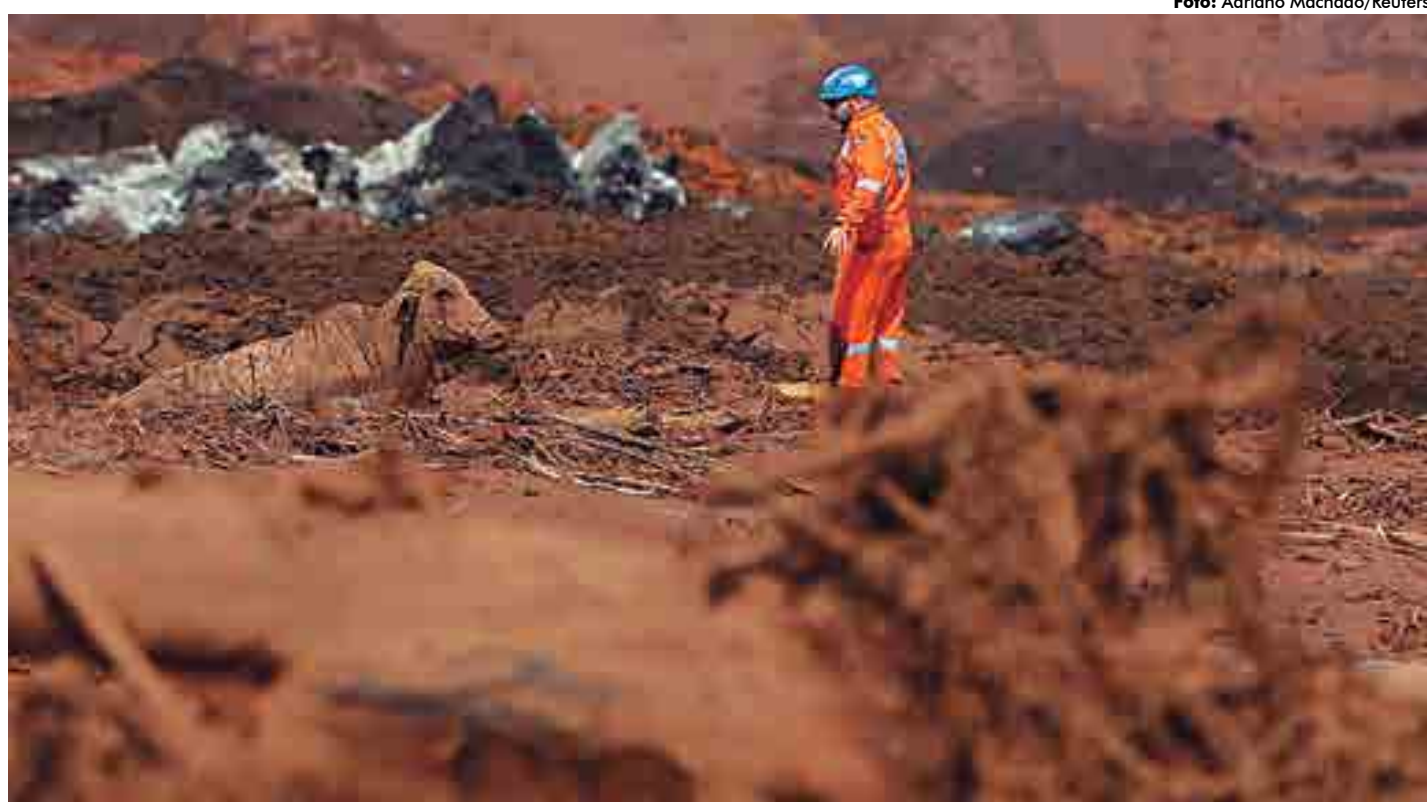
Em decorrência do rompimento da barragem da Vale na Mina do Feijão, 214 pessoas já foram encontradas sem vida e outras 91 estão desaparecidas

A ação do MPT busca orientar o cálculo de pensões vitalícias, que tem como objetivo cobrir os danos materiais. O valor seria equivalente à remuneração integral do trabalhador e o pagamento deveria ocorrer até o momento em que ele completaria 78 anos, expectativa de vida do brasileiro de acordo com o Instituto Brasileiro de Geografia e Estatística (IBGE). Dessa forma, deveriam ser incluídas na pensão verbas trabalhistas que se referem, por exemplo, ao décimo terceiro salário, à média de horas extras e às férias. Na proposta que a Vale havia apresentado, seriam pagos dois terços do salário do trabalhador até o momento em que ele atingiria a idade de