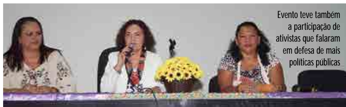
Evento teve também a participação de ativistas que falaram em defesa de mais políticas públicas