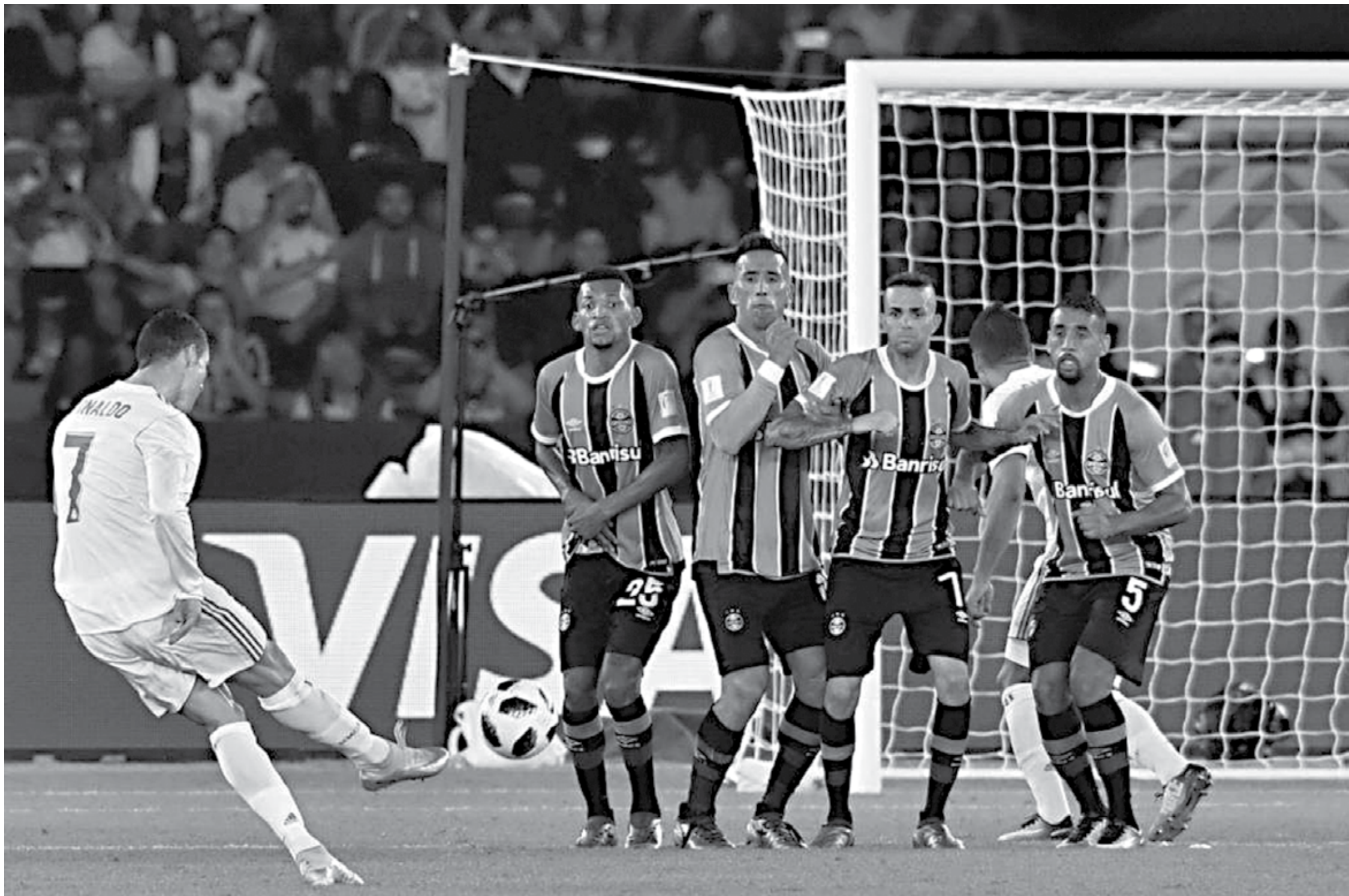
Em 2017, o Grêmio disputou a final do Mundial contra o Real Madrid de Cristiano Ronaldo e perdeu de 1 a 0. O primeiro jogo da equipe gaúcha diante de um europeu foi em 1955, quando venceu o Estrela Vermelha, da Iugoslávia