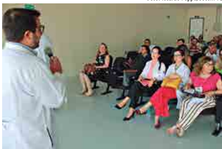
Facilitadores do Hospital Israelita Albert Einstein ministram a qualificação