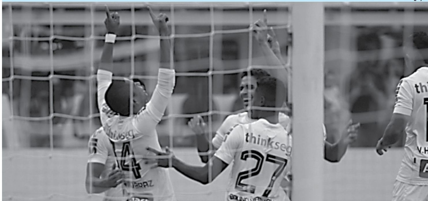
Cena da longa-metragem 'Santos de todos os gols', sob direção de Lina Chamie, que terá lançamento no dia 18 de abril, no circuito comercial do país