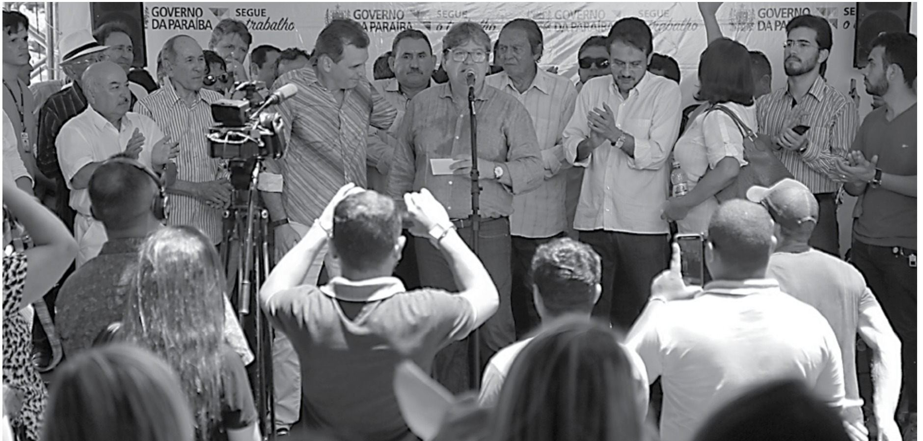
O governador João Azevêdo anuncia a construção da quarta adutora no município: "Qualquer indústria que queira se instalar em Cajazeiras vai saber que terá segurança hídrica"

O governador também assegurou à população que retornará em breve ao município para inaugurar obras que estão em andamento e anunciar novas ações. "Coisas novas virão para Cajazeiras e vamos continuar celebrando os investimentos do governo. Esse