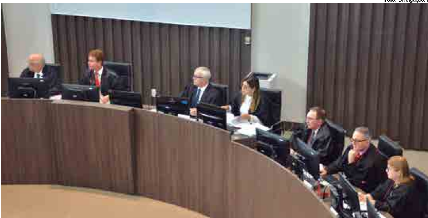
Pleno do Tribunal de Justiça da Paraíba decidiu pela concessão dos pedidos cautelares a fim de suspender a eficácia da Lei nº 1.867 do Município de JP

Mesa Diretora da Assembleia Legislativa e pelo Ministério Público Estadual. O argumento é que já existe no Estado da Paraíba a Lei nº 9.669, de 15 de março de 2012, com as alterações promovidas pela Lei