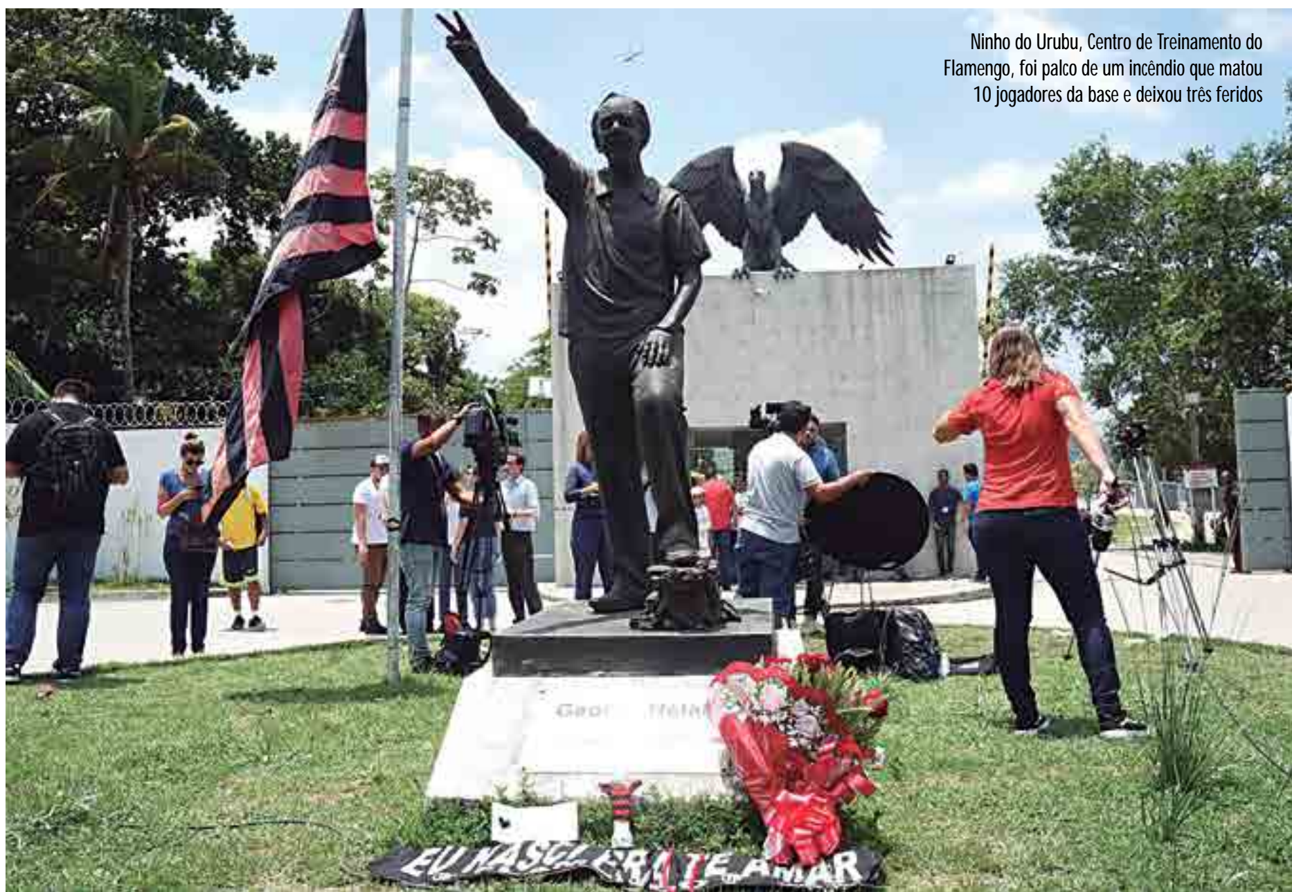
Ninho do Urubu, Centro de Treinamento do Flamengo, foi palco de um incêndio que matou 10 jogadores da base e deixou três feridos

Um incêndio no Ninho do Urubu, como é conhecido o Centro de Treinamento do Flamengo, na zona oeste do Rio de Janeiro, deixou dez mortos e três feridos no dia 8 de fevereiro. As chamas atingiram o alo-