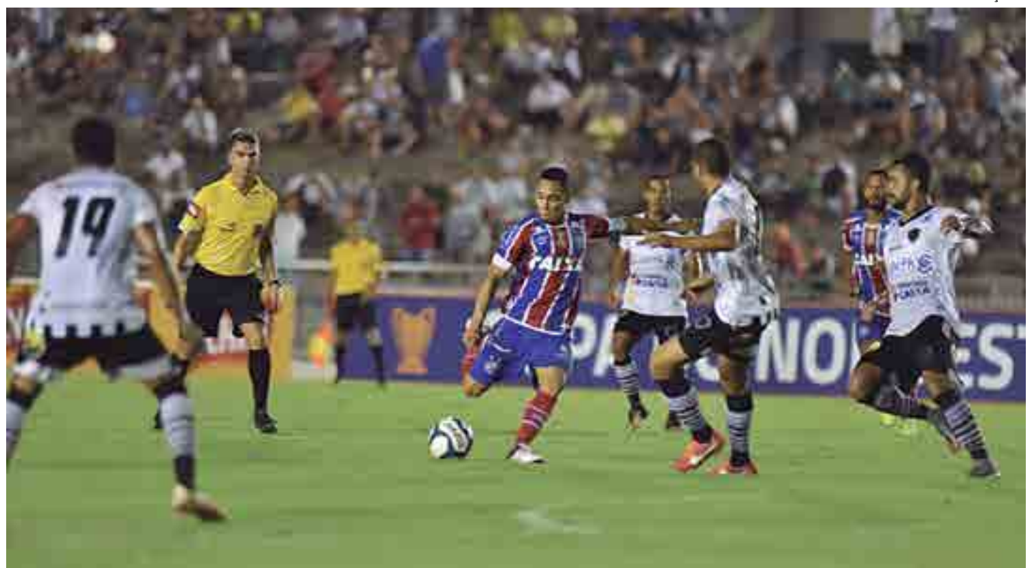
Ano passado, o Botafogo chegou às quartas de final, mas foi eliminado pelo Bahia; porém, na fase classificatória, a campanha não se iguala à deste ano

Terminar em primeiro ou em segundo lugar do grupo, significa para